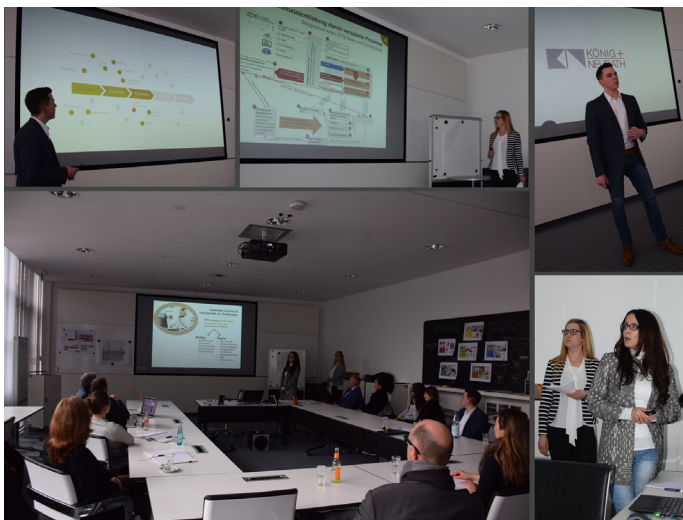
Bild unten: Die sehr erfolgreiche Abschlusspräsentation OM5. Der Kunde war „geflasht“!

Wir haben aber auch gelernt, dass wir unseren Studiengang noch etwas klarer gliedern müssen, um das Kosten/Nutzen-Verhältnis deutlicher zu machen. Aus diesem Grund haben wir das bestehende - zugegebenermaßen unübersichtliche - Curriculum in 27 Vorlesungen/Workshops gegliedert (siehe Folgeseite). Dadurch wird u.a. deutlich, dass wir sehr viel Wert darauf legen, dass alle Aspekte des Online-Marketings erfasst werden und es werden Zusammenhänge klar. Gleichzeitig erhalten Sie etwas mehr Transparenz hinsichtlich der Kosten - jede Vorlesung/jeder Workshop (Freitag/Samstag) kostet tatsächlich nur ca. 200,00 € und das mit einem hochschulzertifiziertem Abschluss am Ende des 12-monatigen Studiums.