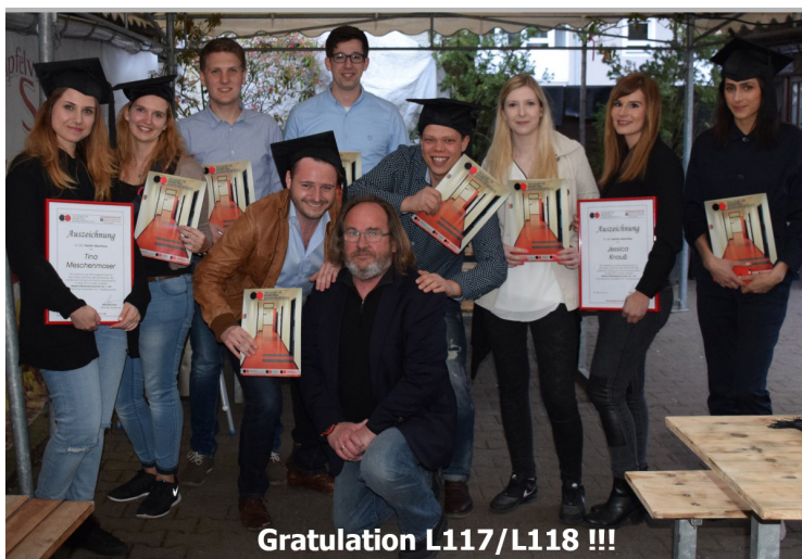
Gratulation L117/L118 !!!

* Auflösung: TWIMC steht für „to whom it may concern“; übersetzt „Für wen es interessant ist“.